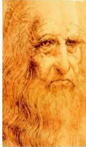
Leonard de Vinci

15. De quel pays est originaire Leonard de Vinci ?