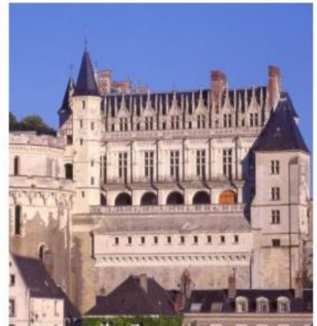
Le château d'Amboise

1. Quand les rois de France viennent-ils s'installer dans la vallée de la Loire ?