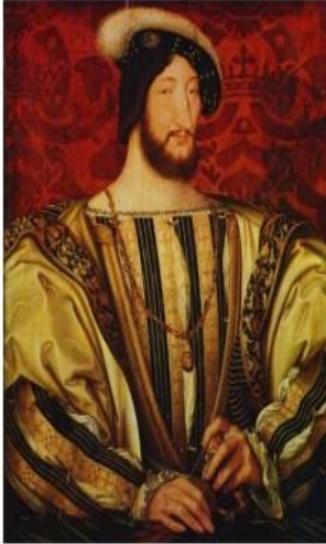
François 1 er